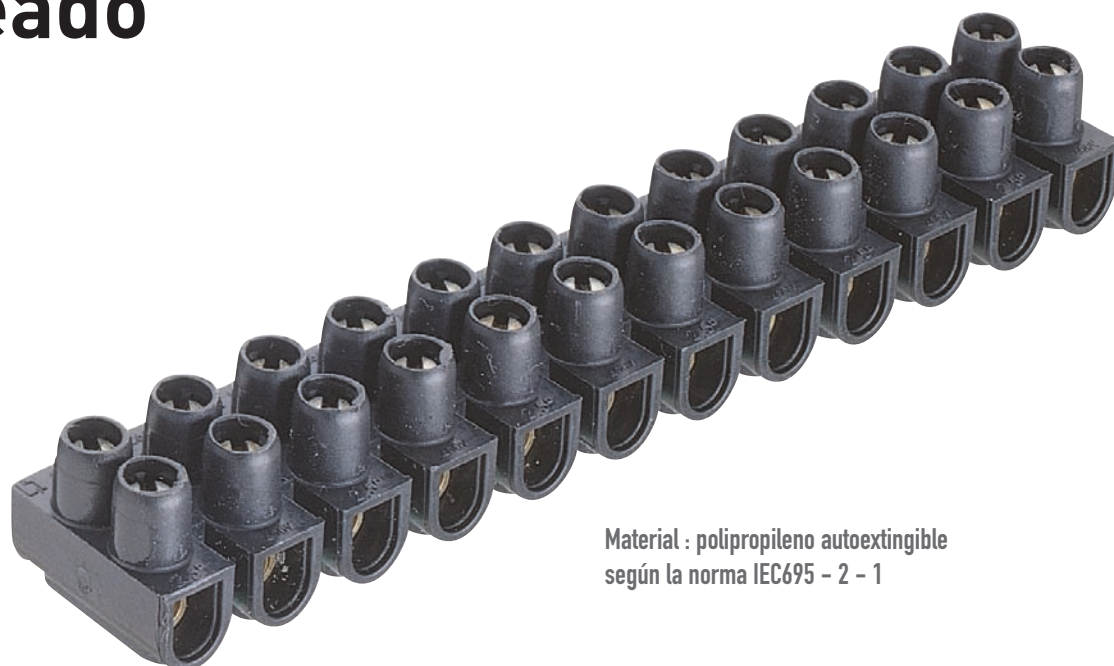
Material : polipropileno autoextinguible según la norma IEC695 - 2 - 1